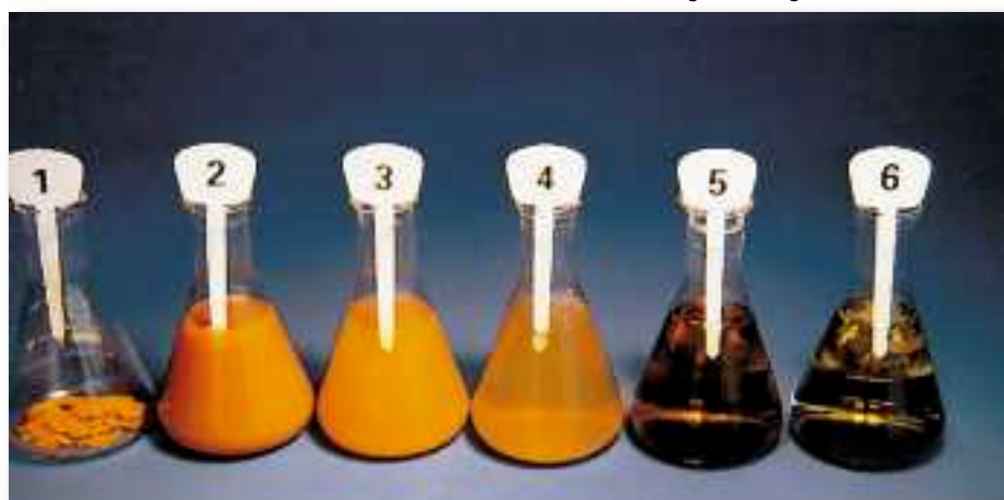
Abb. 2: Auflösung des Belages in nur 12 Stunden

Probe 6: Umwandlung des Belages in wasserlösliche Verbindungen nach 12 Stunden abgeschlossen